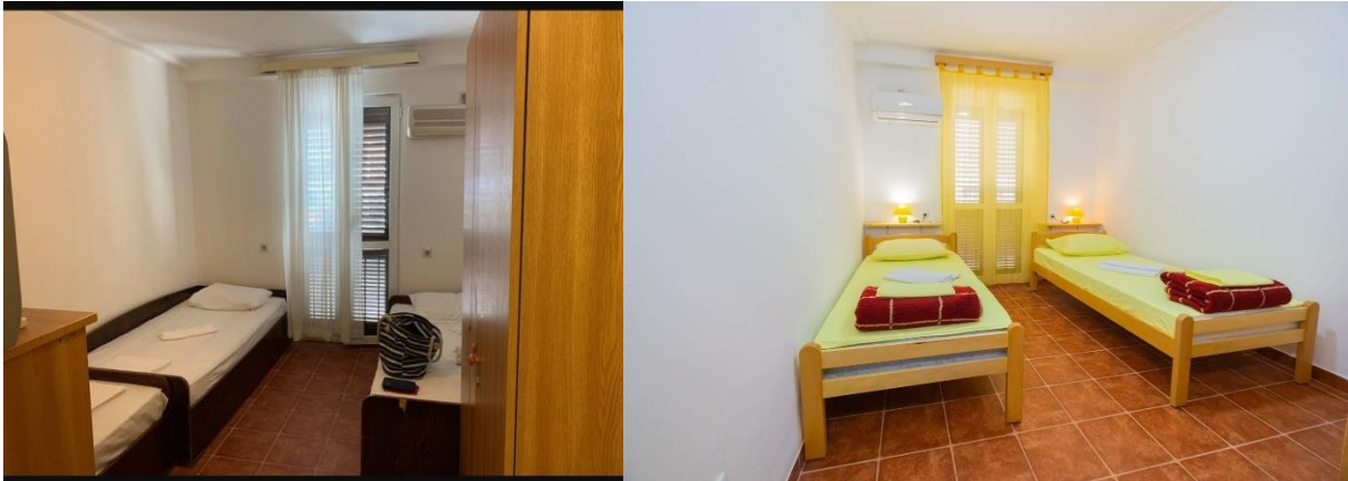
Slika sobe: Nekad i sada